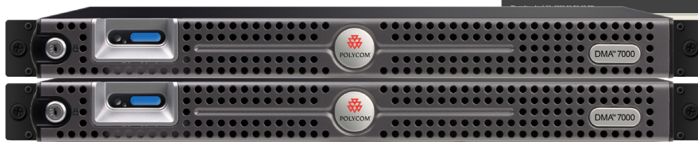
Polycom DMA 7000

до 1200 участников видеоконференции 800 видеовызовов качества HD