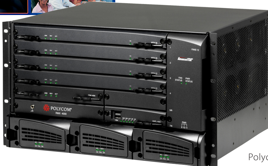
Polycom RMX 4000